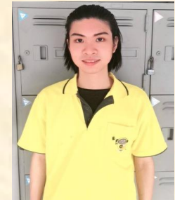
กันทภาษณ์