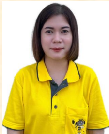
สิรินันท์